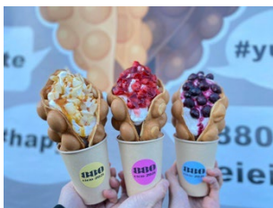
880 kitchen 香港で爆発的人気！バブルワッフル