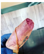
あっぱれOIMON 熟成石焼き芋専門店