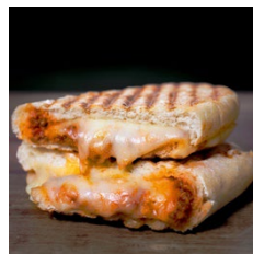
ACERO イタリアンフード