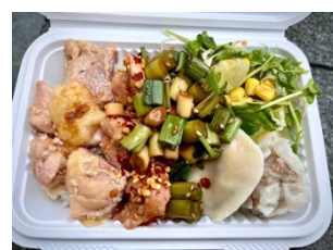
吉清 横浜点心屋台