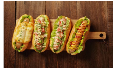
barrcão バハカオン 横浜のブラジル料理