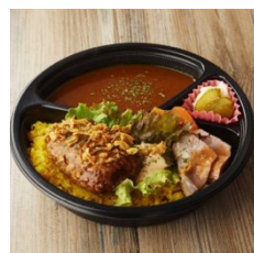
tononoël curry&ricebowl totonoël